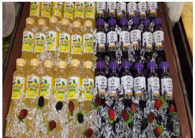
การสำรวจแปลงเกษตรกร - วิชาหกิจชุมชนแปรรูปมัลเบอร์รี่และผลไม้ตำบลคลองใหม่ สินค้าที่จำหน่าย : มัลเบอร์รี่ ผลไม้แปรรูป