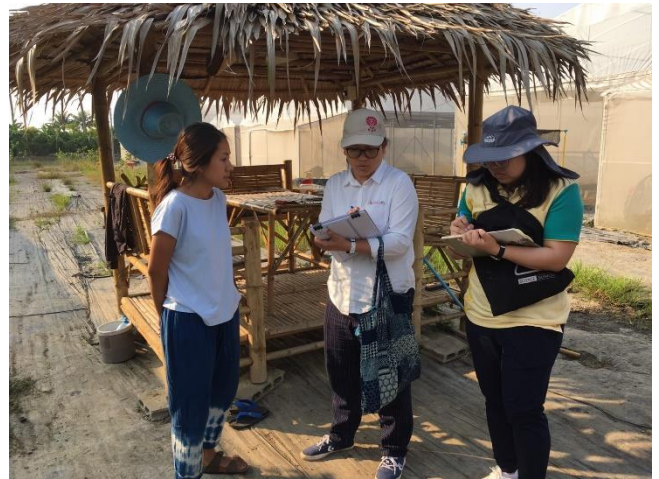
การสำรวจแปลงเกษตรกร - บ้านนอก Organic สินค้าที่จำหน่าย : ผักกูด ผักพื้นบ้าน ผักสลัด