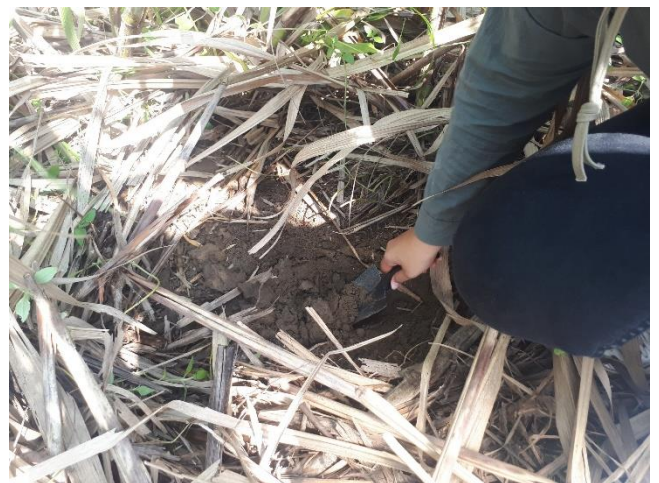
การสำรวจแปลงเกษตรกร - บ้านไร่คื่นรัง สินค้าที่จำหน่าย : น้ำอ้อยคั้นสด อาหารแปรรูป