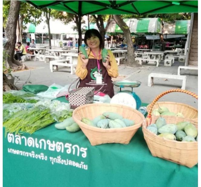
การสำรวจแปลงเกษตรกร - สวนเกษตรหลังเกษียณ สินค้าที่จำหน่าย : ผักสด และอาหารแปรรูป