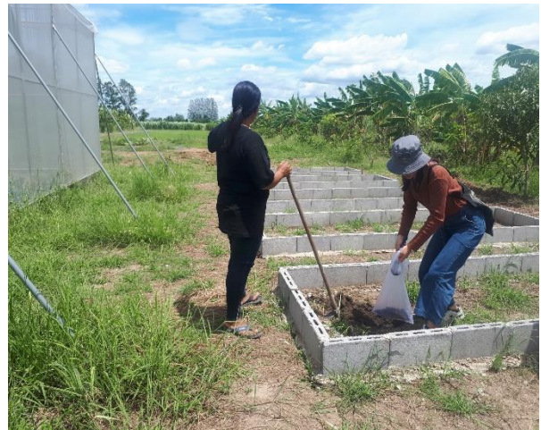
การสำรวจแปลงเกษตรกร - ไร่คำคุณ สินค้าที่จำหน่าย : พืชผัก ผลไม้ อาหารแปรรูป