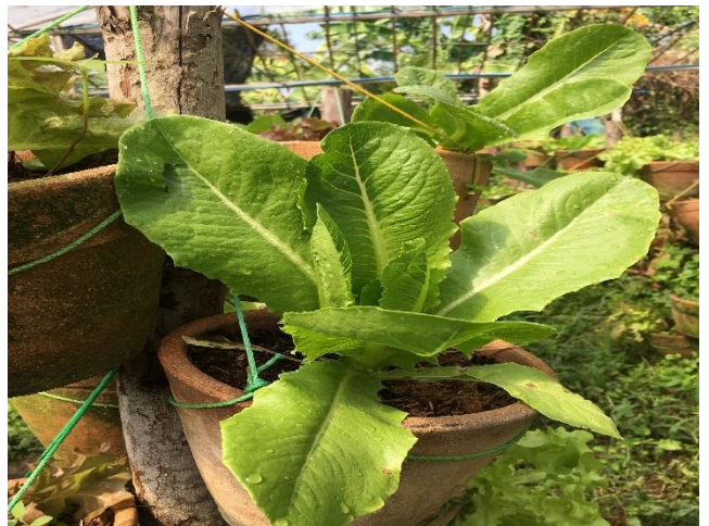
การสำรวจแปลงเกษตรกร - สวนสมบุญ สินค้าที่จำหน่าย : พืชผัก สลัดผัก อาหารแปรรูป