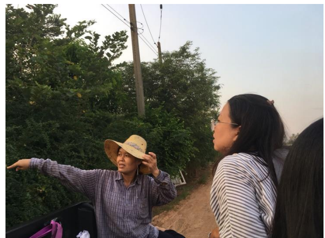
การสำรวจแปลงเกษตรกร - ไร่เลิศผล สินค้าที่จำหน่าย : ข้าว (ข้าวหอมปทุม ข้าวไรซ์เบอร์รี่) ฝรั่ง ไอศกรีม