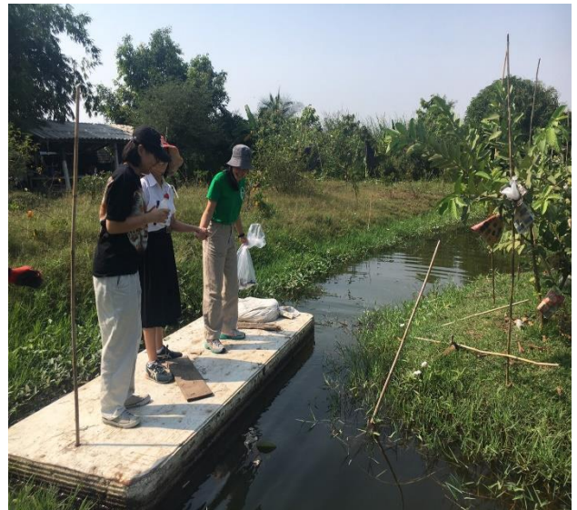
การสำรวจแปลงเกษตรกร - ไร่กำไรทิพย์ กลุ่มเกษตรกรผู้ปลูกผลไม้อินทรีย์ตำบลบ้านใหม่ สินค้าที่จำหน่าย : ข้าวสาร ฝรั่ง มะพร้าว