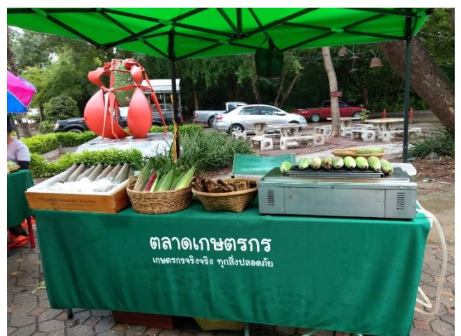
การสำรวจแปลงเกษตรกร - ไร่เคียงดาว สินค้าที่จำหน่าย : ข้าวโพดหวานสด